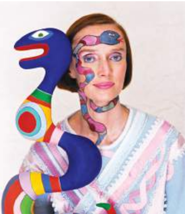
Niki de Saint Phalle, sculptrice, peintre et cinéaste franco-américaine, avec l’une de ses œuvres, 1983. Photo : The Norman Parkinson Archive / Iconic Images © 2025, Niki Charitable Art Foundation / AUI Vis, Brésil.

L’exposition met en lumière l’engagement de l’artiste envers des thèmes tels que l’émancipation féminine, les droits LGBTQIA+ et le racisme. Autodidacte et innovante, Niki a fait de l’art un outil de guérison et de dénonciation. Il s’agit du deuxième partenariat de la Casa Fiat de Cultura avec des institutions françaises — en 2009, lors de l’Année de la France au Brésil, elle a présenté les expositions de Chagall et Rodin. Avec l’exposition Niki de Saint Phalle, l’institution réaffirme son engagement en faveur de l’accès à l’art et aux débats contemporains. Le projet bénéficie du partenariat de la mairie de Nice, du MAMAC et de la collaboration de la Niki Charitable Art Foundation et du groupe 24 Ore Cultura.