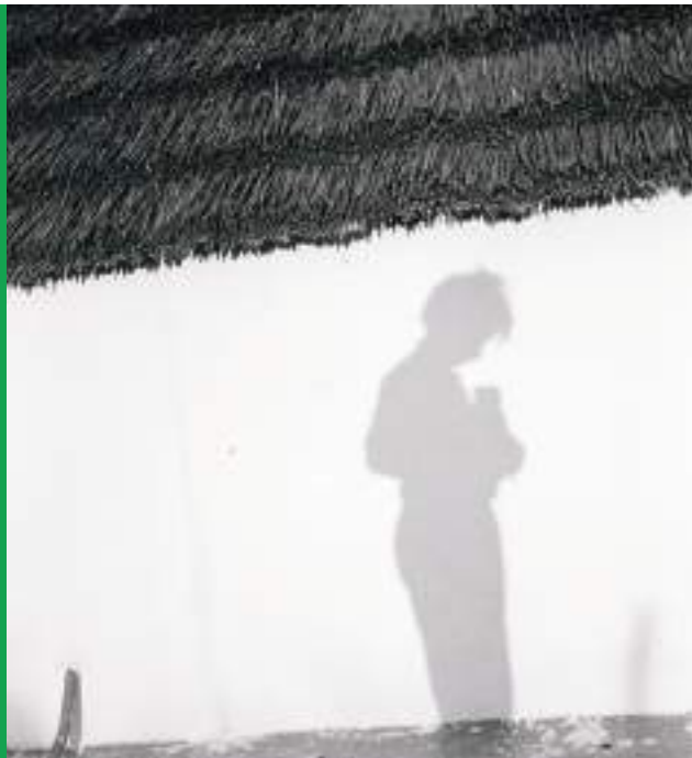
Autoportrait, France, 1950

L’exposition établit également des liens entre la photographie et le cinéma de Varda, en présentant des extraits de ses films où l’image photographique est la protagoniste. « Agnès Varda, photographe » invite le public à découvrir une facette moins connue de l’artiste, réaffirmant son engagement envers l’art comme forme d’écoute, d’empathie et de transformation.