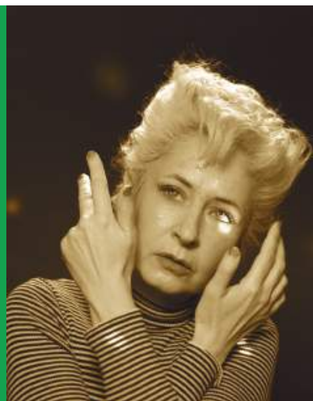
Rayana Rayo, « Désir de changement », Photo : Divulgation

La Pinacoteca de São Paulo a commandé une installation immersive inédite à la célèbre artiste contemporaine française Dominique Gonzalez-Foerster. Reconnue pour son travail à multiples facettes, qui transite entre le cinéma, la musique et les arts visuels, Gonzalez-Foerster explore dans ses œuvres l'urgence de réinventer notre environnement, le rendant plus habitable et connecté aux besoins humains. La nouvelle création sera présentée à l'Octógono, un espace emblématique situé au centre de la Pinacoteca, et promet d'offrir aux visiteurs une expérience sensorielle inédite. L'installation invitera le public à plonger dans un environnement interactif et stimulant, engageant différents sens et favorisant une réflexion sur notre relation avec l'espace environnant. L'œuvre de Gonzalez-Foerster, avec ses confluences créatives, offre une perspective innovante sur la façon dont nous pouvons réimaginer et habiter nos environnements de manière plus significative et durable.